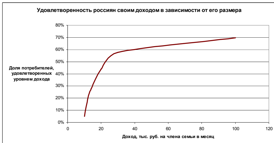
Рис. 2. Изменение удовлетворенности потребителей своим благосостоянием при изменении дохода

Время, необходимое жителям различных городов для достижения желаемого уровня жизни, а также доля населения, уже добившегося целевого уровня потребления, приведены в Приложении 4.