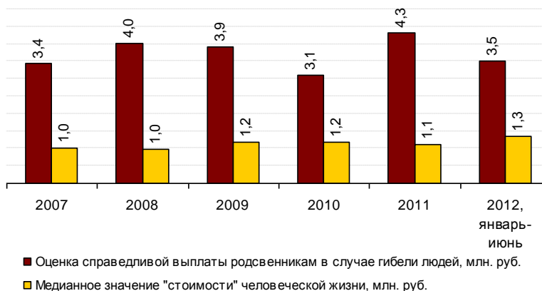
Динамика "стоимости" человеческой жизни

Из графика видно, что значение «стоимости» жизни упало в кризис, однако в 2011 году оно начало расти и превысило докризисные показатели. А за период с 2011г. по апрель 2012г. «стоимость» человеческой жизни сократилась на 0,8 млн. рублей или на 18,6%. То же самое касается и медианного значения «стоимости» жизни. Это позволяет сделать вывод о том, что у населения России снизились требования к качеству жизни – справедливая и закономерная реакция на ожидание экономического кризиса.