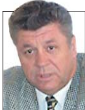
Александр ГУБВИН Губернатор Астраханской области

«Росгосстрах — один из крупнейших страховщиков в Астраханской области, имеющий крепкие связи с постоянными и новыми страхователями.»